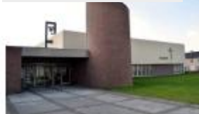
H. Annakerk (Hintham)