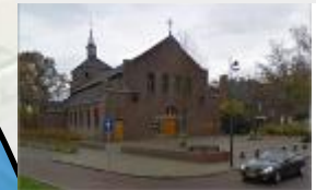
Sint Lambertuskerk (Rosmalen)