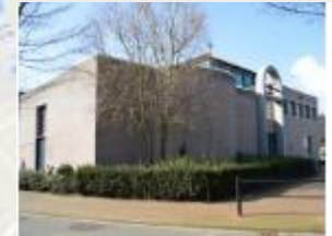
H. Landelinuskerk (Empel)