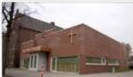
Sint Anna (West)