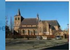
H. Laurentiuskerk (Rosmalen)